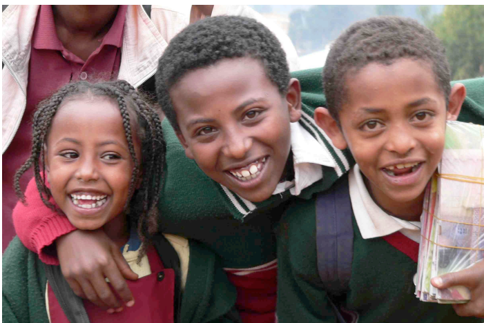
Mise à jour : mai 2011