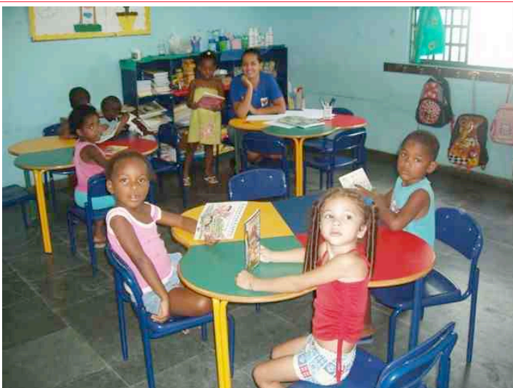
Mise à jour : mai 2011