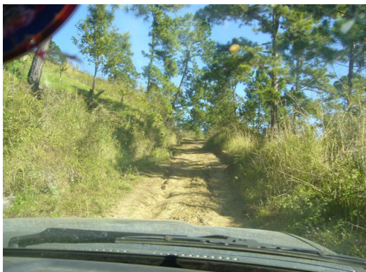
Le chemin d'accès à La Pintada

Une partie des élèves est scolarisée à l'extérieur du hameau, ce qui est pénalisant pendant les saisons de pluie.