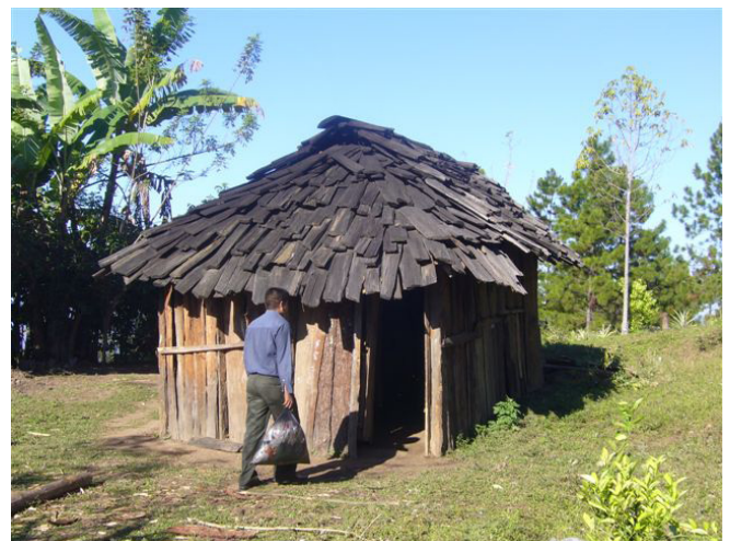
Une habitation de La Pintada

La tribu « la Pintada » comprend 10 hameaux. Celui qui nous intéresse est "la Joya n° 1" créé en 1920 avec 22 habitants. Il compte aujourd'hui 42 maisons et une population de 480 habitants. Les familles ont beaucoup d'enfants, il peut y en avoir jusqu'à 10 par foyer.